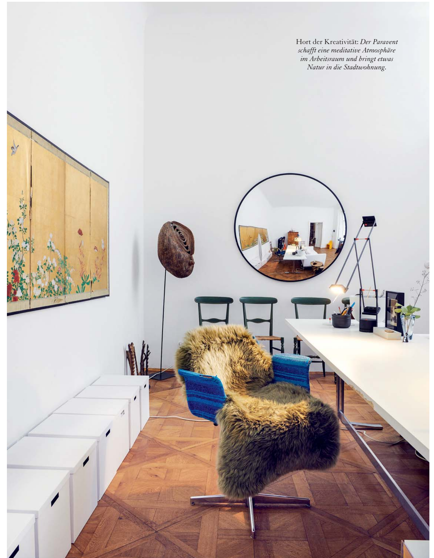
Hort der Kreativität: Der Paravent schafft eine meditative Atmosphäre im Arbeitsraum und bringt etwas Natur in die Stadtwohnung.