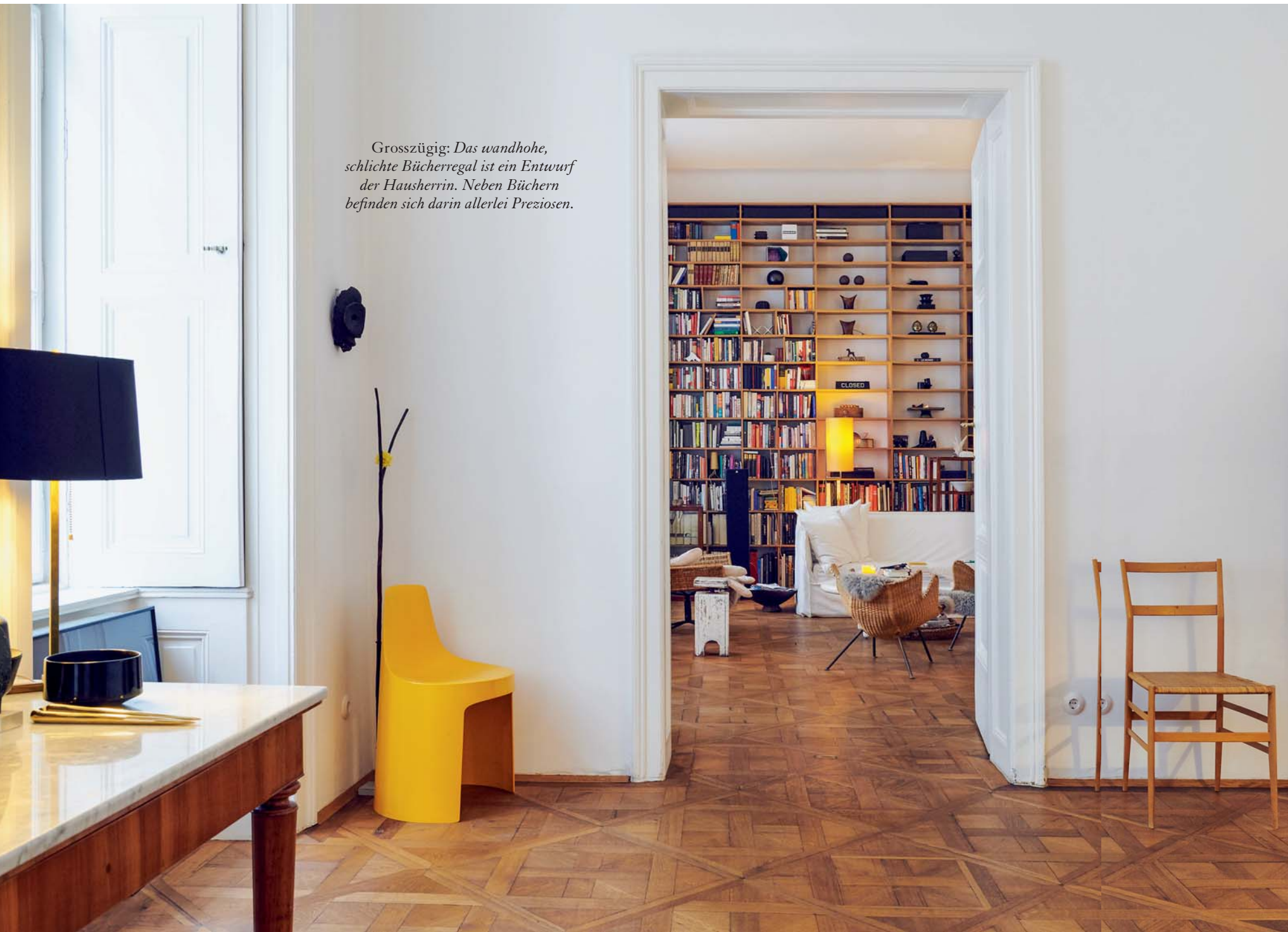
Grosszügig: Das wandhohe, schlichte Bücherregal ist ein Entwurf der Hausherrin. Neben Büchern befinden sich darin allerlei Preziosen.

Klassische Designstücke mischt die Designerin frisch fröhlich mit Flohmarkt-Fundstücken oder Trophäen von ihren Reisen.