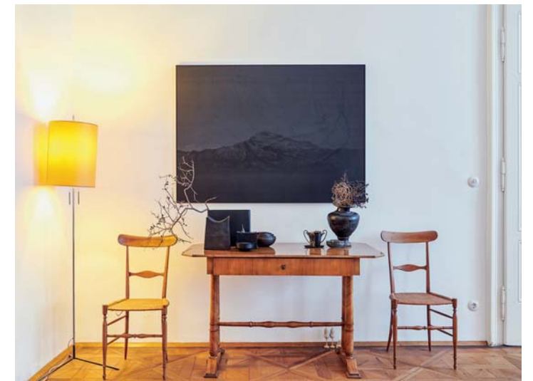
Schwarzer Faden: Eine Vorliebe für dunkle Objekte zieht sich durch die ganze Wohnung. Italienische Chiavari-Stühle.

tenhändlern, wächst sie umgeben von erlesenen Objekten auf und lernt diese schätzen. Dass sie eine besondere emotionale Bindung zu materiellen Gütern entwickelt, führt sie auch auf die Tatsache zurück, dass beide Eltern einen Flüchtlingshintergrund besitzen. Später studierte sie Malerei und Grafik an der Universität der Angewandten Künste, es folgten Meisterjahre im Bereich Produktdesign