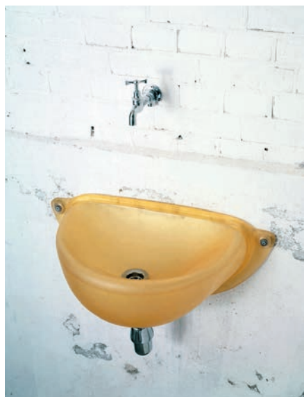
OBEN «Pushed Washtub», 1996, von Hella Jongerius. © Jongeriuslab

RECHTS Beim Umbau eines Stalles setzten Kueng Caputo überall Farben ein. Dennoch wirkt der Raum nicht laut.