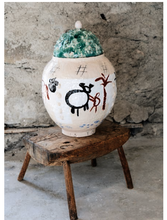
«Slow is too fast», 2026, Handaufbau, Steinzeug, Engobe, transparente Glasur, von Yvonne Rogenmoser.

So charakterisieren Kollisionen von widersprüchlichen Bildwelten die Keramikobjekte und Illustrationen von Yvonne Rogenmoser. Sie gleichen Schnappschüssen von Paralleluniversen: Popkultur trifft auf Mythologie, Geometrisches auf Verschnörkeltes. Bei genauerer Betrachtung entdeckt man bei ihren von Hand aufgebauten Gefäßen immer wieder neue Details, inklusive sprachlicher Botschaften auf der Rückseite einer Serie von blau-weißen Tellern, wo sie spontane Einfälle festhält – egal, wie wunderbarlich diese auch sein mögen. «Viel bunt» oder «Träume und Schliessfächer» heisst es da etwa. Nichts ist bedeutungslos, auch das Absurde nicht, flüstern uns diese Gegenstände zu. Manchmal kann Gestaltung viel, gerade dann, wenn sie ihre Grenzen ausreizt. Sie kann zum Beispiel zeigen, dass Paradoxes zum Alltag gehört. Und dass viel Schönheit in Furchtlosigkeit liegt.