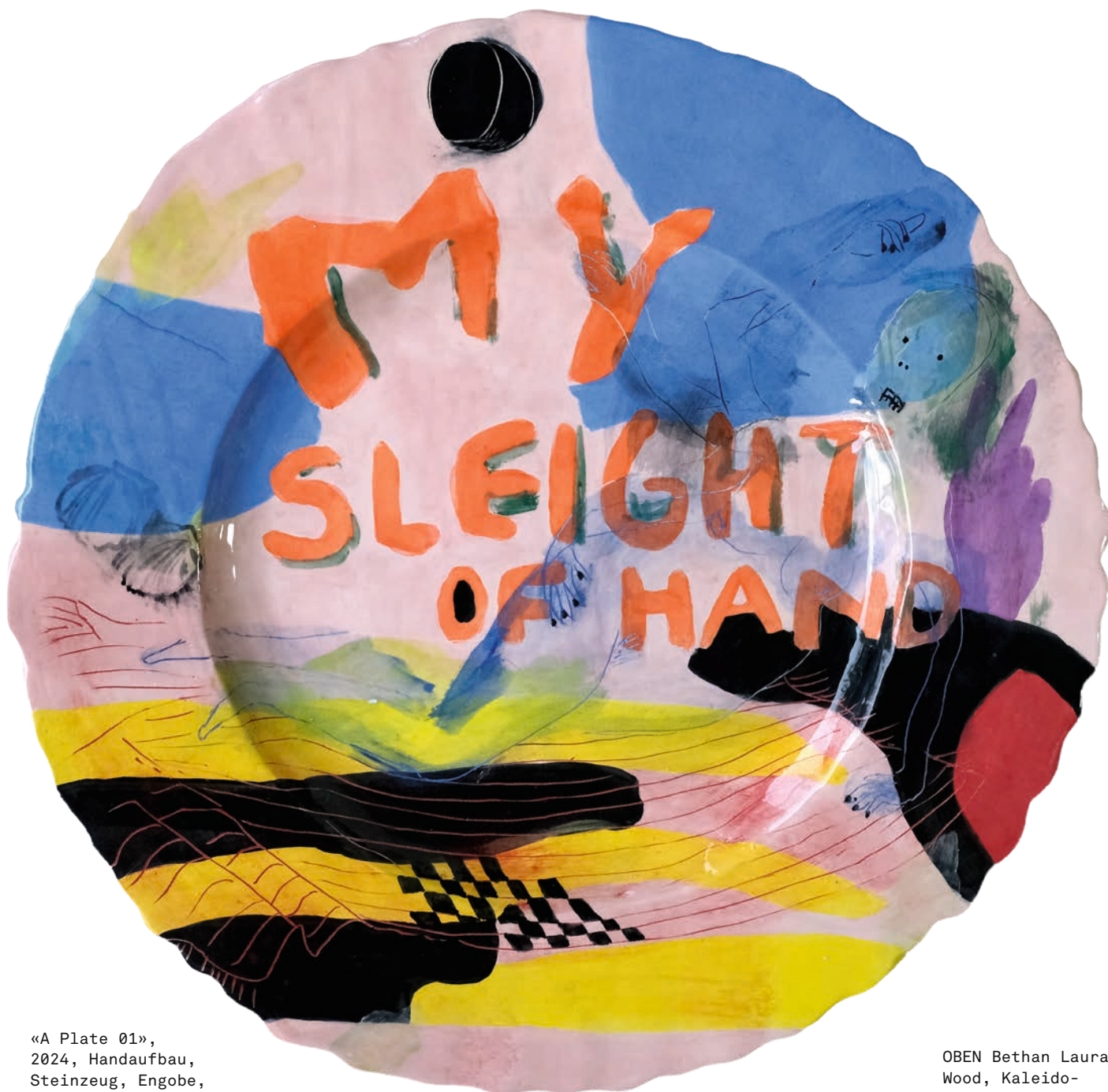
«A Plate 01», 2024, Handaufbau, Steinzeug, Engobe, transparente Glasur, von Yvonne Rogemoser.