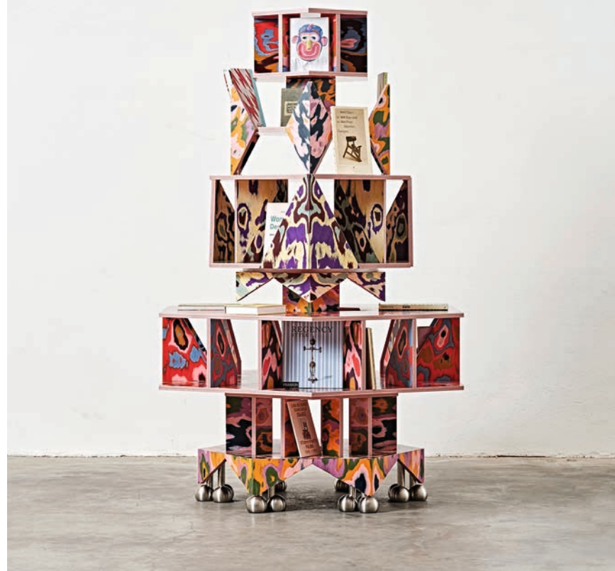
Das totemartige, von allen Seiten zugängliche Bücherregal von Bethan Laura Wood wirkt durch Überfülle an Details und Farben.