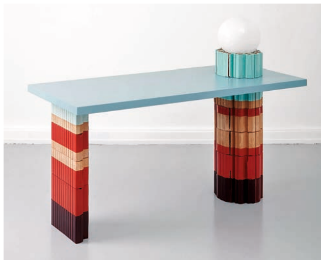
Die Kollektion «Bricks» (2023) von Kueng Caputo aus Schweizer Backsteinen vereint Industrieprodukt und Handwerk.