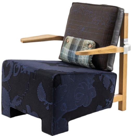
Der Sessel «The Worker» von Hella Jongerius entstand 2006 für Vitra.

Die niederländische Gestalterin kombiniert alte Verarbeitungstechniken mit neuester Technologie. Sie sieht ihre Arbeit als Teil eines nie endenden Prozesses. Design sollte für sie eine vermittelnde Rolle zwischen dem Menschen und seiner Lebenswelt einnehmen. Ihre experimentellen Entwürfe tragen die Spuren ihrer Entstehung zur Schau. Bis zum 6. September 2026 ist ihre Retrospektive «Whispering Things» im Vitra-Design-Museum zu sehen. Das Museum beherbergt seit 2024 ihr Archiv. Jongerius wurde mit verschiedenen Preisen geehrt. jongeriuslab.com