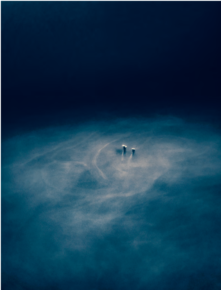
Die Fotoserie «Where Waters Meet», in der Julian Charrière die geisterhaften Erscheinungen von Apnoetauchern eingefangen hat, erhellt die dunkle Welt des Meeres.