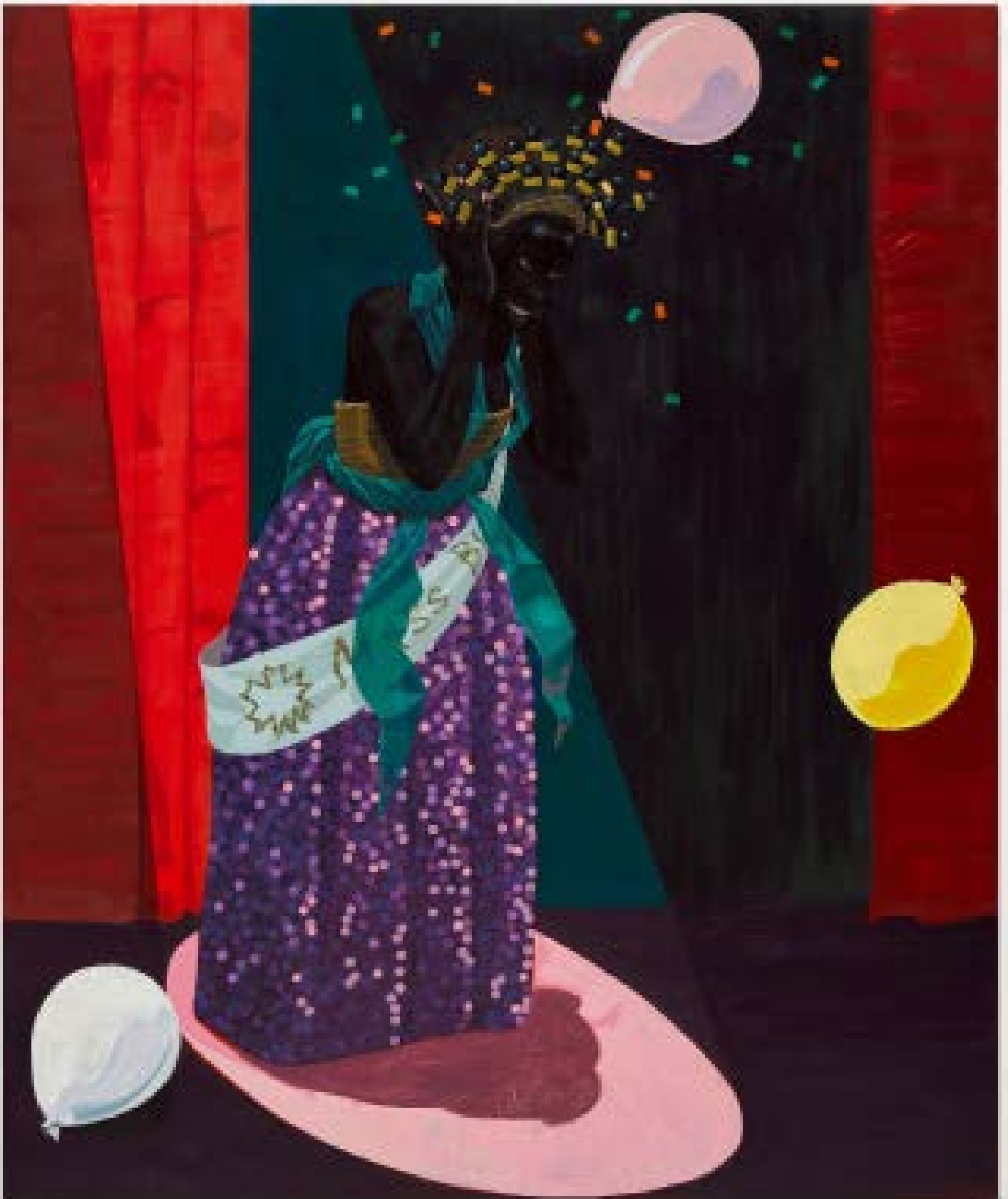
«Kunstwerke passieren nicht einfach, sie werden gemacht»: Untitled (Beauty Queen), 2014 von Kerry James Marshall.