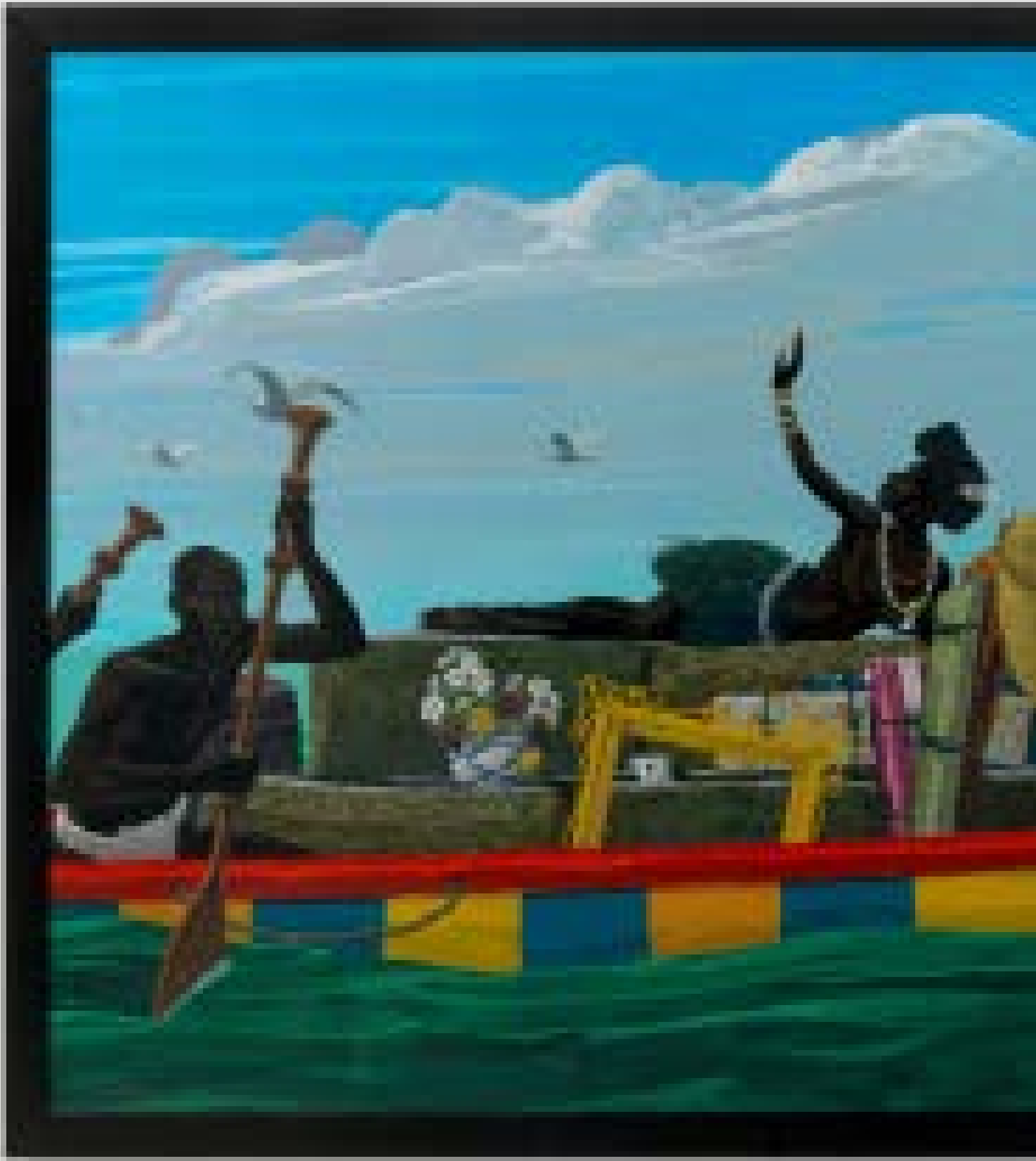
«Auch Afrikaner waren am Sklavenhandel beteiligt. Nur sprechen wir Schwarzen kaum drüber» - «Haul», 2025, von Kerry James Marshall.