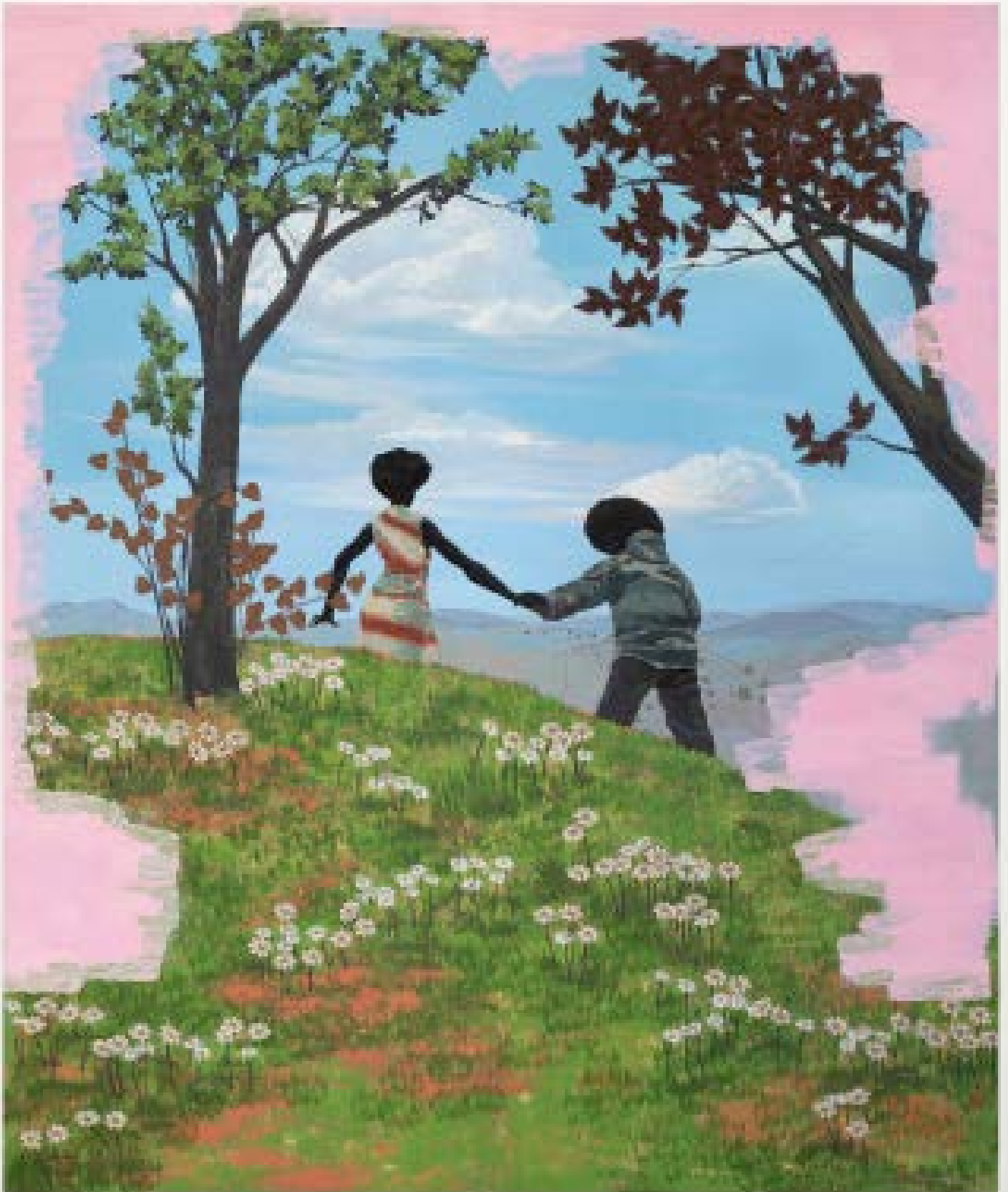
«Wird ein schwarzer Gegenstand im Schatten noch schwärzer?»: xxxxx, von Kerry James Marshall.